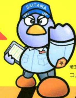
埼玉県マスコット コバトン