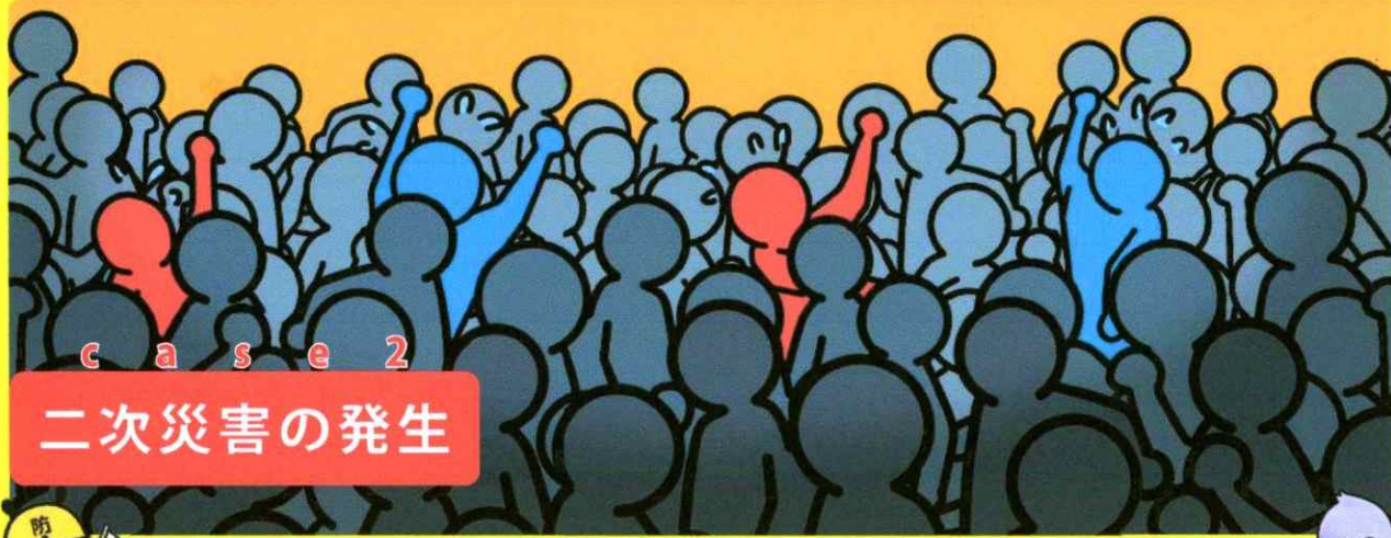
case 2 二次災害の発生