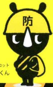
東京都マスコット 防サイくん