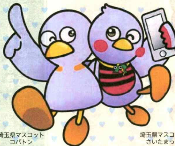
埼玉県マスコット コバトン