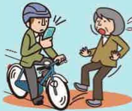
スマホ等使用運転