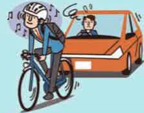
イヤホン等使用運転